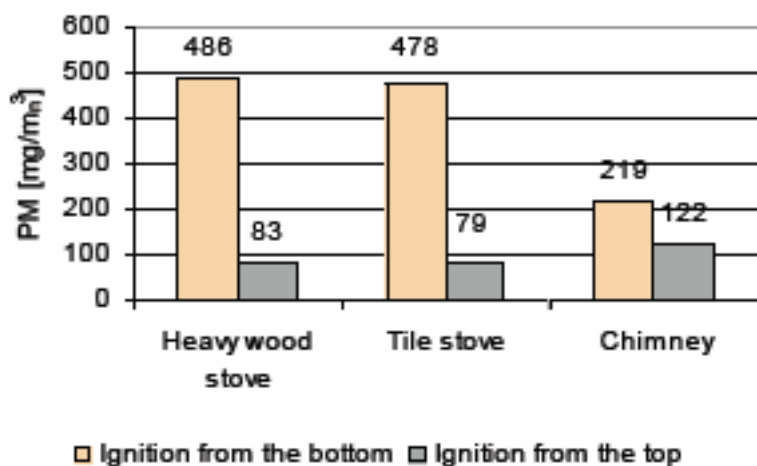
Figure 5 PM emissions in three different combustion devices operated with ignition from the bottom and ignition from the top using an ignition module [6].

De "80% af partiklerne" kommer på banen i teksten til artiklens fig. 5.